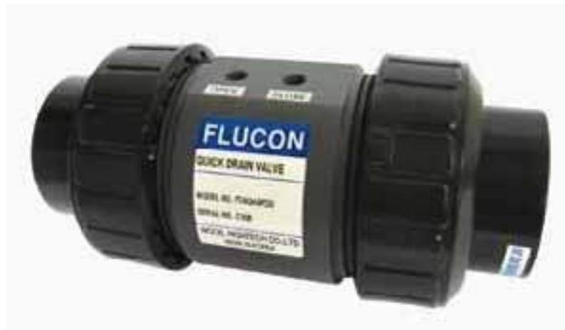
Quick drain Valve Air operated quick drain valve